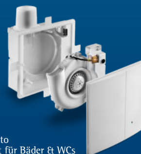
Silvento Abluft für Bäder & WCs