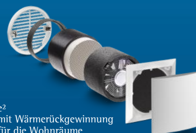
e 2 mit Wärmerückgewinnung für die Wohnräume