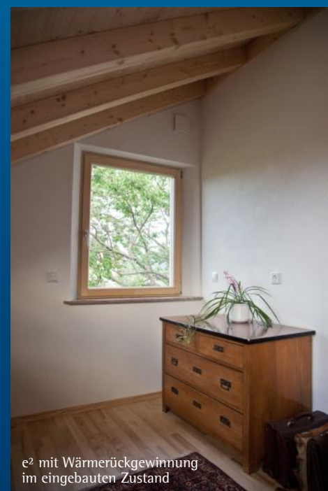
e 2 mit Wärmerückgewinnung im eingebauten Zustand