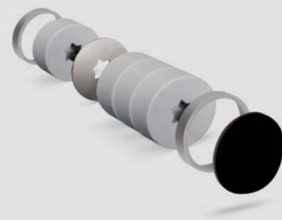
Built-in device ALD-S

Products and illustrations may vary slightly. Due to continuous product development and/or several suppliers e.g. for raw materials, colours, among other things, may vary slightly (not for visible parts) or be shown differently in brochures.